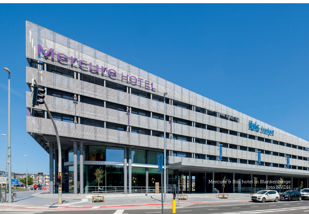
Mercure & Ibis hotel in Blankenberge